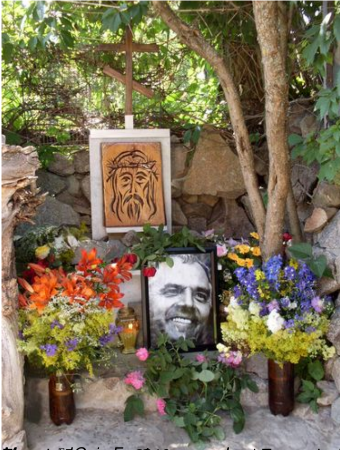
Дорогоцінний батько, якого врятував Бог у тіні Черкащині. Він тривалий час хворів на