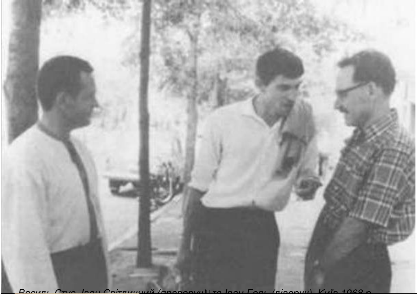
Василь Стус, Іван Світличний (праворуч) та Іван Гель (ліворуч). Київ 1968 р.