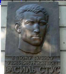
Василь Стус у гуртожитку в Києві за адресою бульвару Академіка 1963—1965