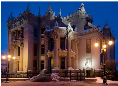
"Будинок із химерами" (1901–1903), Київ Автор: Сергій Рижков

Міжнародний день пам'яток і визначних місць - відзначається щороку 18 квітня. Спрямований на підвищення обізнаності громадськості з різноманіттям культурної спадщини, її вразливістю та необхідністю ефективних зусиль заради збереження її для подальших поколінь... читати далі