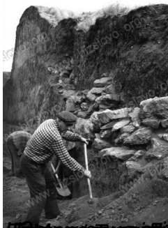
Бабина могила в селі Мозолівці. Була відкрита в 1976 році