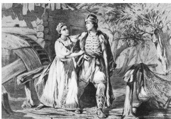
Русалка. Ілюстрація художника Трутовського К.

Как бросилась без памяти я в воду Отчаянной и презренной девчонкой И в глубине Днепра-реки очнулась Русалкою холодной и могучей, Прошло семь долгих лет – я каждый день О мщенье помышляю... И ныне, кажется, мой час настал.