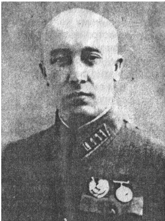
Полковник Сергей Горшков

Как посчитало командование ВВС, в Никополе уже существовала для этого минимальная материальная база: на северной окраине - взлетно-посадочная полоса, на Днепре - речная пристань и (главное!) нефтебаза (построенная в 1935-1936 гг.), железнодорожная станция, телеграфно-телефонное сообщение и, наконец, аэроклуб и радиотехническая школа.