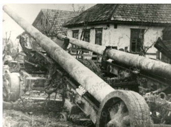
□ Брошенные □ немецкие пушки в Никополе. □ Зима 1943-1944 гг.

Утром 1 февраля после 15-минутной артподготовки наступление советских войск возобновилось. В бой были введены дополнительные силы. Особенно жестокий бой состоялся за с. Приют. Несколько фронтальных атак успеха не имело. Село переходило из рук в руки... Тогда новый командир 74-й гв. сд. решил: окружить опорный пункт противника обходным маневром и, войдя в село, в рукопашном бою уничтожить сопротивление фашистов. И это блестяще удалось.