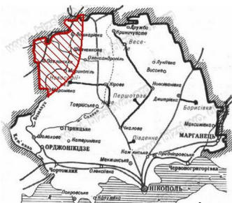
Место прорыва обороны немецких войск в Никопольском районе. 30.01–1.02.1944 г.