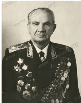
Маршал Советского Союза Чуйков В.И.

армии, а также 5-я штурмовая и 288-я истребительная авиадивизия 1-го смешанного авиакорпуса 17-й воздушной армии.