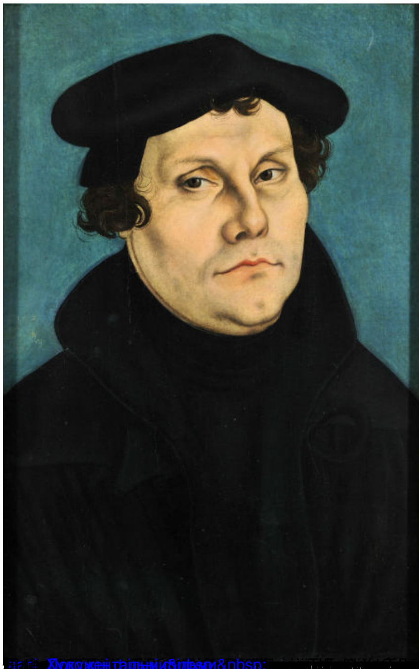
16. Холокост під час Реформації