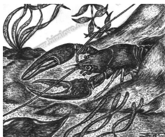
Рак біля входу до нори

Втім, такі байки розповідали хіба що довірливим подорожнім і малолітнім хлоп'ятам, щоб зайвий раз не утрудняти себе відповіддю на питання: «Де раки зимують?». А якщо серйозно, як же все-таки проводить холодну пору року ці дивовижні створіння природи?